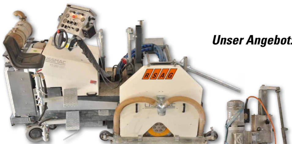
1 Fugenschneider VM