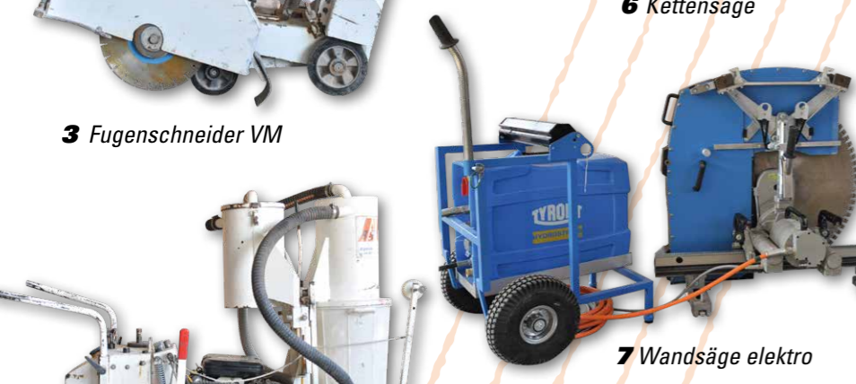
7 Wandsäge elektro

1 - Fugenschneider VM 98 KvA Schnitttiefe max. 480 mm Schnitttiefe max. 630 mm Ausweitschnitt, Breite bis 16 mm Kanäle schneiden, Breite bis 80 mm Tiefe bis 120 mm