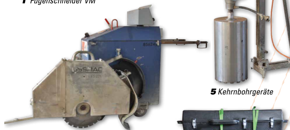
2 Fugenschneider elektro